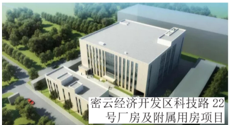
密云经济开发区科技路22号厂房及附属用房项目

本报讯 9月初，杭萧钢构战略合作参股公司——河北钢山杭萧钢结构工程股份有限公司（以下简称“河北钢山杭萧”）连续中标6个项目，分别为密云经济开发区科技路22号厂房及附属用房项目、北京市十一学校石景山学校新建工程、门头沟档案馆新馆建设项目钢结构工程、武汉热力试验室钢网架制作项目、四川成都航空产业园三期厂房建设工程、邯郸城发大厦项目钢结构工程。