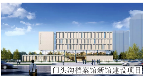
门头沟档案馆新馆建设项目

北京市十一学校石景山学校新建工程项目位于北京市石景山区，占地面积约为3.88公顷，总建筑面积44305m 2 。本项目分为4幢教学楼，全部地下采用现浇钢筋混凝土框架结构，地上采用钢框架-支撑结构，基础为带柱墩防水板基础。其中教学楼A地上5层，高23.95m；教学楼B地上5层，高23.95m；教学楼C地上4层，高20.10m；教学楼D地上2层，高10.50m。学校建成后提供48个班，其中初中36班，高中12班，提供初中学位1440个，高中学位540个，有效解决石景山地区教育资源不足问题。