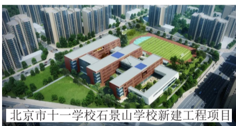
北京市十一学校石景山学校新建工程项目

密云经济开发区科技路22号厂房及附属用房项目位于北京市密云经济开发区，总建筑面积16827.24m 2 ，主要包括两个厂房，1#厂房地面4层，地下一层，建筑高度22.200m，采用装配整体式框架-现浇剪力墙结构，基础类型为独立基础加防水板；2#厂房及附属用房地上三层，建筑高度11.700m，采用钢筋混凝土框架结构，基础为独立基础。项目建成后将作为生产医药类产品基地。