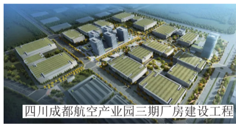
四川成都航空产业园三期厂房建设工程

武汉热力试验室钢网架制作项目位于武汉市江夏区，建筑面积17000m 2 ，其中主厂房地面1层，结构类型钢排架，檐口高度34.3m；辅房地面5层，结构类型混凝土框架。项目建成后主要应用于工程热力学、传热学及相关课程的配套实验等方面，将有效促进相关产业科研工作的进一步发展。