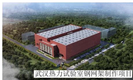
武汉热力试验室钢网架制作项目

武汉热力试验室钢网架制作项目位于武汉市江夏区，建筑面积17000m 2 ，其中主厂房地面1层，结构类型钢排架，檐口高度34.3m；辅房地面5层，结构类型混凝土框架。项目建成后主要应用于工程热力学、传热学及相关课程的配套实验等方面，将有效促进相关产业科研工作的进一步发展。